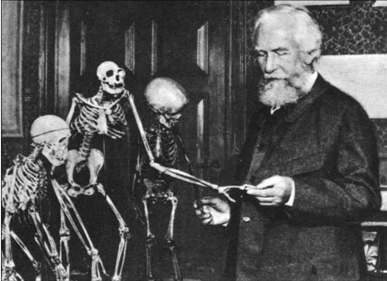
Ernst Haeckel (1834- 1919)

taron la misma filosofía de investigación. El magnífico resultado de este esfuerzo fue un gran aumento en la calidad de nuestro entendimiento. Varios previamente misteriosos fenómenos (por ejemplo, la generación de potenciales eléctricos en las membranas de las células, o la producción y transmisión de señales en las células nerviosas o la influencia de la luz sobre procesos bioquímicos como en la fotosíntesis) empezaron a entenderse. Y sobre todo, este movimiento científico creó la firme convicción de que las células son realmente complejísimas máquinas químicas. A partir de esas décadas, la investigación biológica comenzó a utilizar con fluidez métodos químicos y físicos con el objetivo de medir a las actividades biológicas, y también descripciones matemáticas para tratar de explicar el significado de esas medidas.