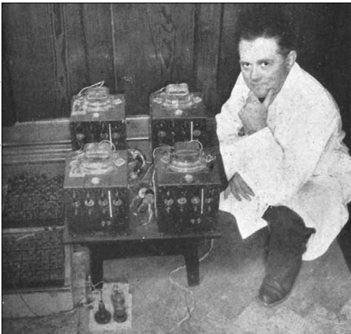
W. Ross Ashby junto a su homeóstato.

vías nerviosas, ni siquiera de las propiedades biofísicas elementales de las neuronas? Para responder a esto, es necesario entender que para Ashby, el cerebro no era una estructura “flotante”, susceptible de ser comprendido en sí mismo, sino que era un especializado dispositivo al servicio de la homeostasis, un refinado órgano que conduce a la mejor adaptación del organismo a un ambiente concreto.