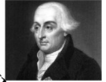
J.L. Lagrange (1736-1813)