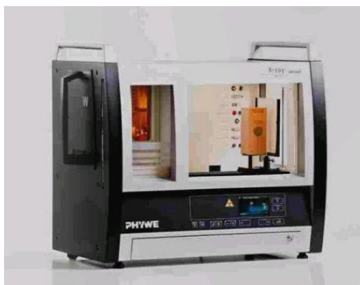
Fig 2. Dispositivo generador de rayos X PHYWE

Ajustar el voltaje de aceleración en 35 KV y la corriente de tubo a 1mA.