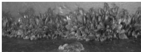
Figura 2. Limnoperna fortunei (Embalse Baygorria).

Mitílido conocido como mejillón dorado, originario de sistemas de agua dulce del SE de China, catalogado como especie invasora de la región Neotropical (Darrigran 2002) (Fig. 2). Introducida accidentalmente en la región en 1991 por medio de las aguas de lastre (Darrigran & Pastorino 1995), se lo encuentra en sistemas de agua dulce y/o salobres con salinidades no mayores a 3 (Darrigran 2002). En Uruguay fue registrada por primera vez en 1994 en la zona costera del Río de la Plata (Scarabino & Verde 1995) encontrándose actualmente en cinco de las seis principales cuencas hidrográficas: Río de la Plata, Río Uruguay, Río Negro, Río Santa Lucía (Brugnoli et al. 2005; Langone 2005) y recientemente fue reportada para la Laguna Merín (Langone 2005). En la cuenca del Río de la Plata, Brugnoli et al. (2005) sugieren que el límite E de distribución estaría asociado a la isohalina de 2-3. En la cuenca Atlántica aún no existen reportes de esta especie. Sin embargo su ingreso es posible a través del canal San Gonzalo que conecta el sistema Laguna de los Patos-Merín y posteriormente por medio de dispersión mediada hacia la cuenca Atlántica (Brugnoli et al. 2005). En la cuenca de la Laguna Merín y Atlántica existen ecosistemas prioritarios para su conservación (PROBIDES 1999) y su ingreso a estos sistemas pone en peligro su biodiversidad acuática.