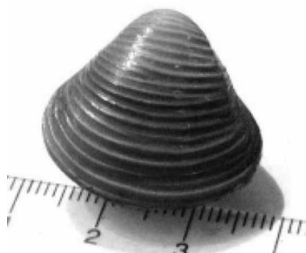
Figura 1. Corbicula fluminea (Embalse Rincón del Bonete).

En la costa argentina del Río de la Plata, la distribución se extiende hasta Punta Blanca incluyendo el submareal, encontrándose esporádicamente en Punta Indio (35°53'S-58°25'W) (Darrigran 1992). Recientes estudios encontraron que C. fluminea fue la especie dominante en términos de biomasa en la zona interna y media del submareal del Río de la Plata, relacionado con salinidades óptimas para la especie (Rodríguez Capítulo et al. 2003). En la costa uruguaya se reporta para La Caballada y Santa Lucía, sitios caracterizados por baja salinidad (Giménez et al. 2005).